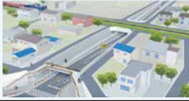
57 深谷嵐山線(上原) 秩父鉄道アンダーパス部の 完成イメージ