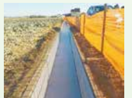
1 荒川中部左幹線 (かんがい排水事業) 用水路工